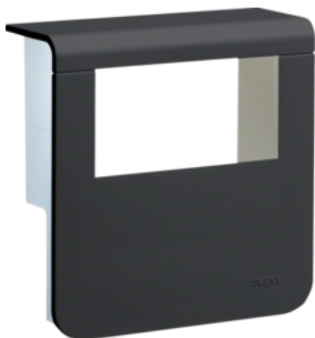
tehalit.SL Pokrywa nośnika urządzeń 20x80 2*45x45 czarny