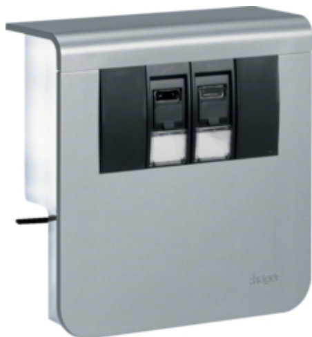
tehalit.SL Nośnik urządzeń 20x80 2xRJ45 Kat.6 alu