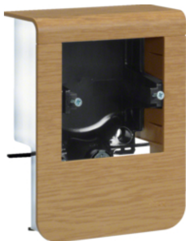
tehalit.SL Pusty nośnik urządzeń 20x80 fi60 dąb