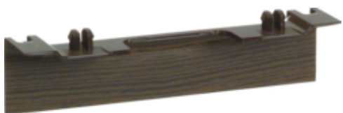
tehalit.SL Maskownica nośnika 20x55 fi60 sucupira