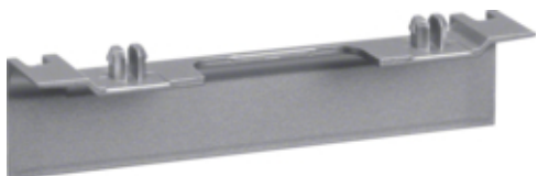
tehalit.SL Maskownica nośnika 20x55 fi60 alu