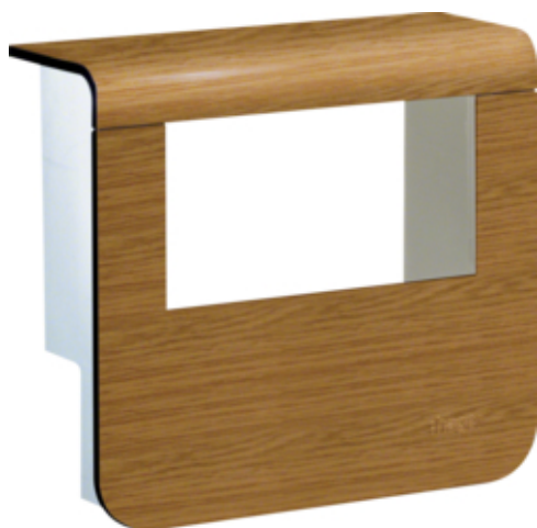
tehalit.SL Pokrywa nośnika urządzeń 20x55 2*45x45 dąb