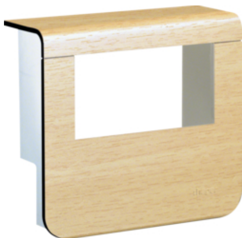
tehalit.SL Pokrywa nośnika urządzeń 20x55 2*45x45 klon