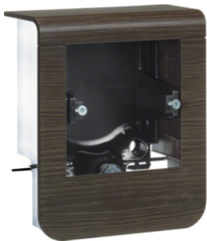
tehalit.SL Pusty nośnik urządzeń 20x55, fi60, sucupira