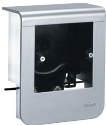
tehalit.SL Pusty nośnik urządzeń 20x55, fi60, alu