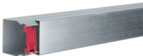
tehalit.LFS Kanał stalowy 60x60mm, ocynk