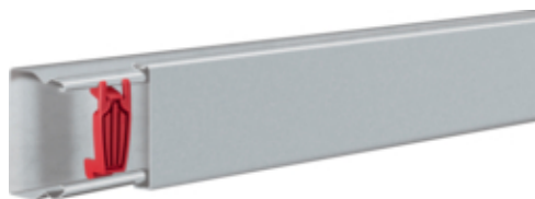
tehalit.LFS Kanał stalowy 40x60mm, ocynk