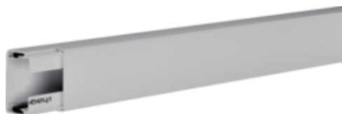
tehalit.LFH Kanał elektroinstalacyjny bezhalogenowy 30x45mm, jasnoszary