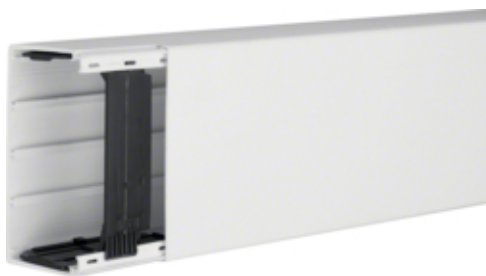
tehalit.LF Kanał elektroinstalacyjny PVC 60x110mm, biały