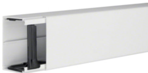
tehalit.LF Kanał elektroinstalacyjny PVC 60x90mm, biały