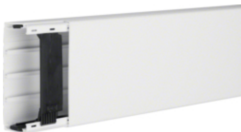
tehalit.LF Kanał elektroinstalacyjny PVC 40x110mm, biały