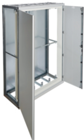
univers Obudowa stojąca IP41 kl.I 1350x2000x600mm RAL7035