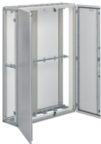
univers Obudowa stojąca IP54 kl.II 1350x1900x400mm RAL7035