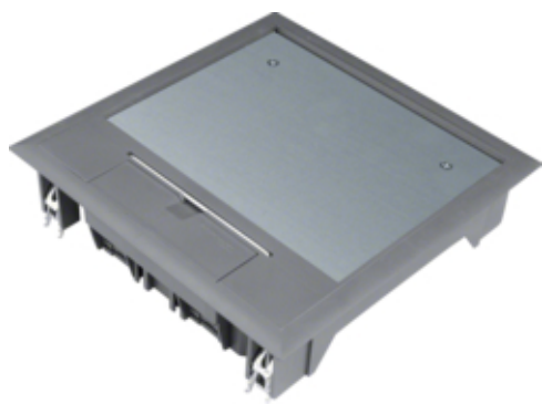
tehalit.VE-EE Pokrywa uchylna VQ06 200x200 wykładzina 5mm stal szary PA