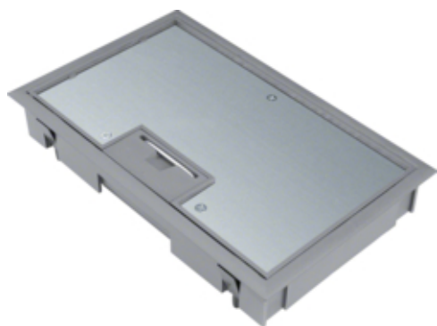
tehalit.VE-EE Pokrywa uchylna płytki montaż E04 147X247 5mm stal szary PA