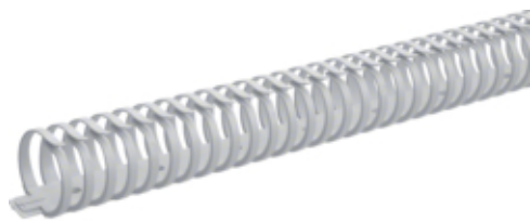
tehalit.VK flex 40 Kanał grzebieniowy L=500mm szary