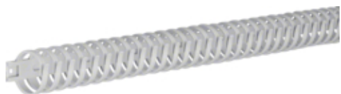
tehalit.VK flex 30 Kanał grzebieniowy L=500mm samoprzylepny szary