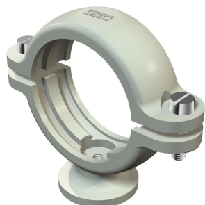
Uchwyt cokołowy ISO 20,5-22mm