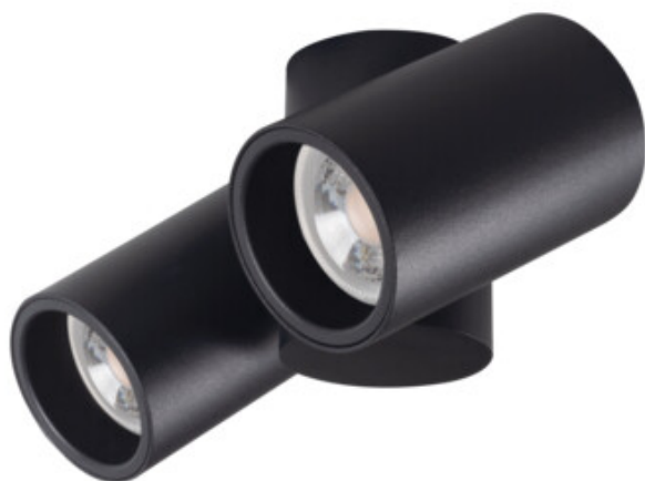
BLURRO 2xGU10 CO-B