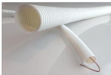
Fot. 1 RKLGHF z PC/ABS 320 N bez pilota i z pilotem