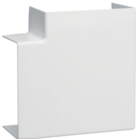
tehalit.LF/LFF Kąt płaski 60x110mm, biały