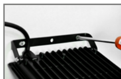
prosty montaż oprawy bez konieczności odkręcania uchwytu