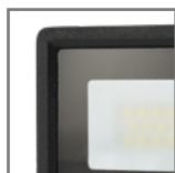
szkło z powłoką „frosted glass”