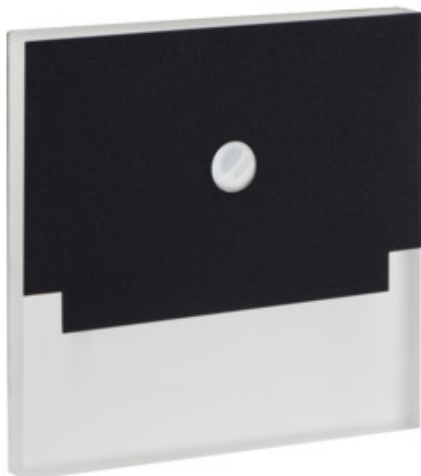
SABIK LED PIR B