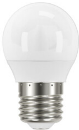
IQ-LED G45E27 4,2W