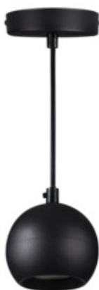
GALOBA C 1xGU10 B