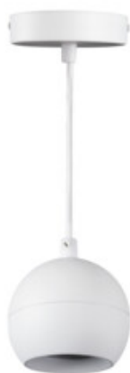
GALOBA C 1xGU10 W