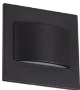
ERINUS LED LL B