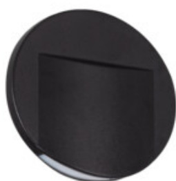
ERINUS LED O B