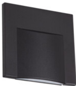
ERINUS LED L B