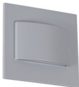
ERINUS LED LL GR