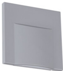
ERINUS LED L GR