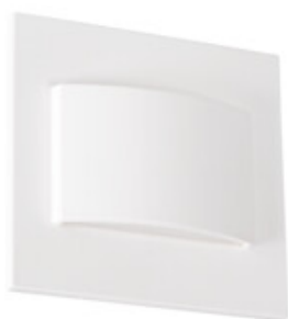
ERINUS LED LL W