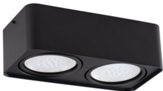
TUBEO ES 250-B