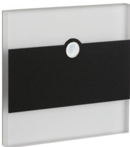
TERRA LED PIR B