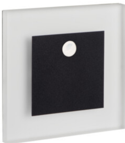
APUS LED PIR B