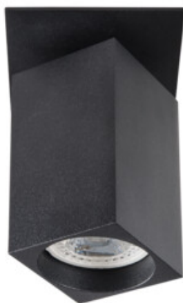
CHIRO GU10 DTL-B