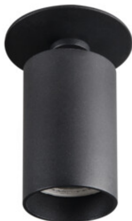
CHIRO GU10 DTO-B