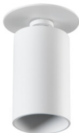
CHIRO GU10 DTO-W