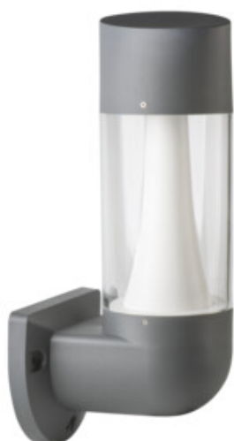
INVO TR EL-53-O-GR