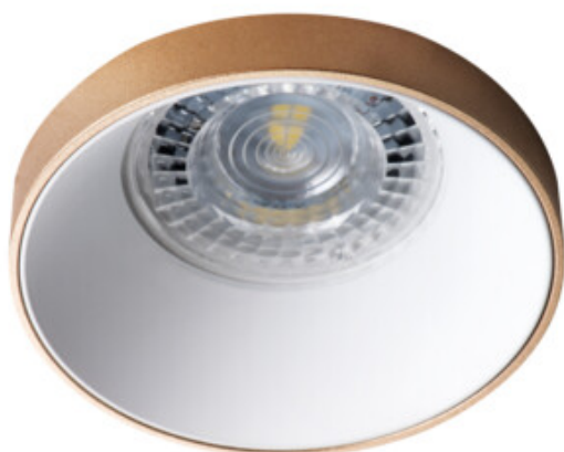
SIMEN DSO G/W