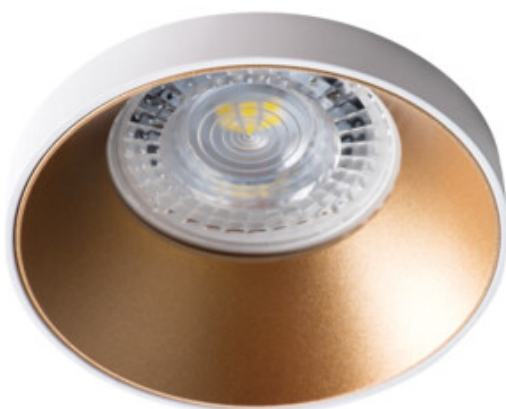
SIMEN DSO W/G