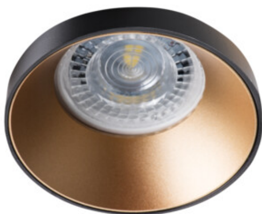
SIMEN DSO B/G