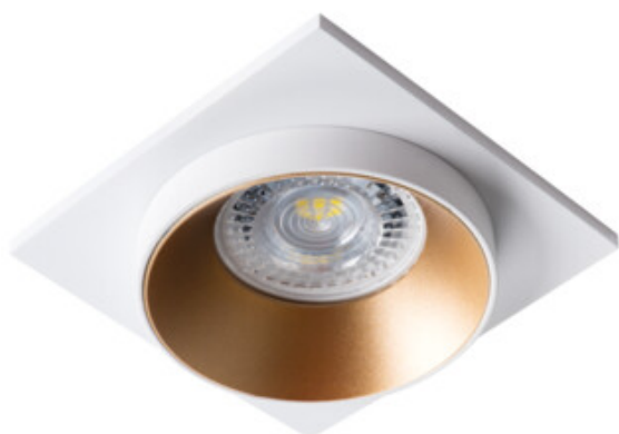
SIMEN DSL W/G/W