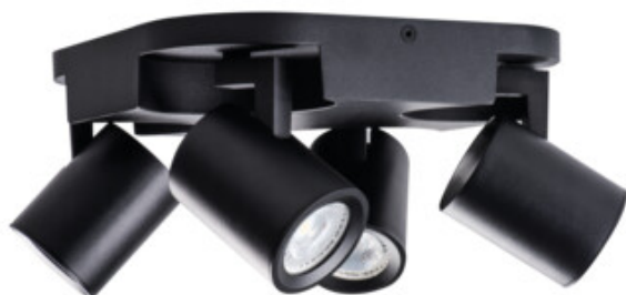
LAURIN EL-40 B