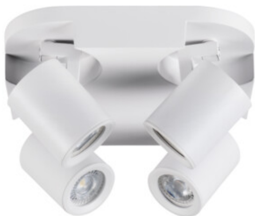
LAURIN EL-40 W