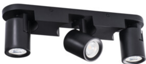
LAURIN EL-3I B